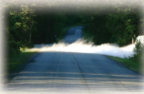
**This photo represents an actual propane vapor cloud. Esta foto representa una nube verdadera de vapor de propano.**